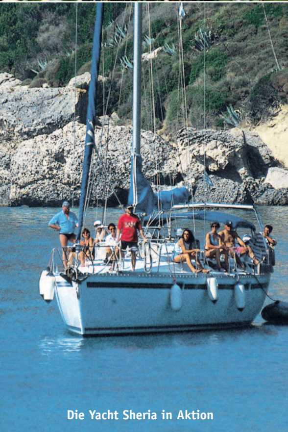
Die Yacht Sheria in Aktion